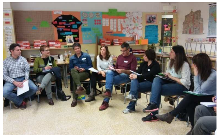
Imatges corresponents a diversos espais de treball compartits durant el curs 2016-2017