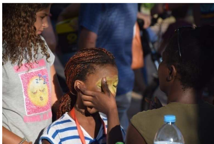
Imatges corresponents a diverses activitats de la III edició del Projecte de Les Tardes d'Estiu al Carrer, juliol 2017